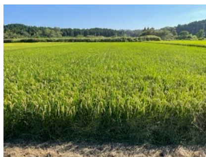
富岡町でのさくら福姫の栽培