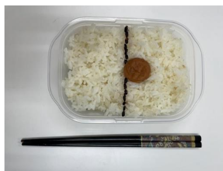
米レシピ 新日の丸弁当「米一粒分」! (白米はさくら福姫、ラインは府中市産黒米使用)